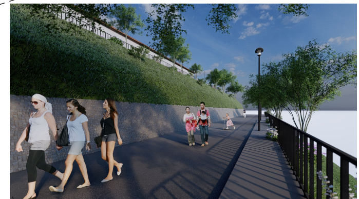
MEJORAMIENTO DEL ESPACIO PÚBLICO