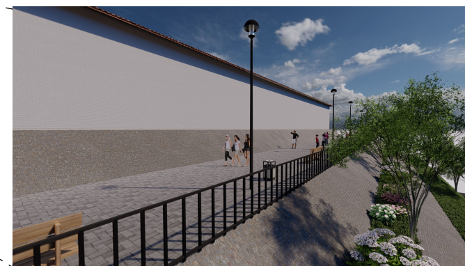
ARBORIZACIÓN DEL ÁREA DE PROTECCIÓN