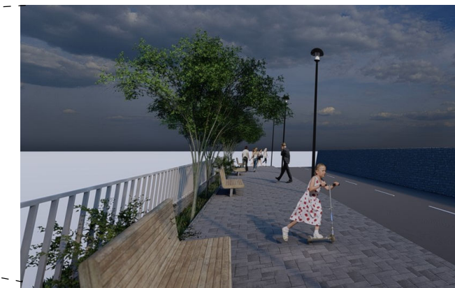
AMPLIACION DE VEREDA, INSTALACIÓN DE MOBILIARIO URBANO, ARBORIZACIÓN EN ÁREAS DE PROTECCIÓN.