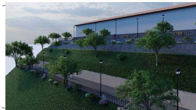
CONFORMACION DE BANQUETAS Y ARBORIZACION